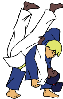
O-goshi Grote heup