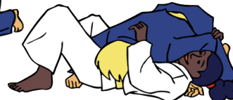
Yoko-shiho-gatame Zijwaartse 4 puntencontrole