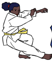
Yoko-ukemi Zijwaartse val