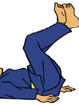
Ushiro-ukemi Achterwaartse val