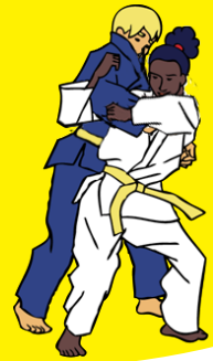
Ippon-seoi-nage Eenzijdige rugworp