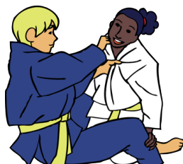
Kata-juji-jime Eenzijdige gekruiste verwurging