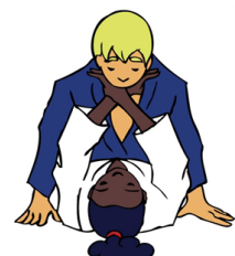
Gyaku-juji-jime Omgekeerde gekruiste verwurging