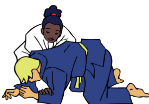
Uke bok Ellebogen/knieën

Rode tekst: deze techniek kan gevaarlijk zijn (niet geschikt voor beginnende judoka)