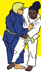
O-soto-gari Grote buitenwaartse maai