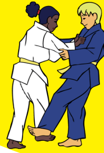
De-ashi-barai Voorste beenveeg