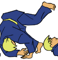
Zempo-kaiten Voorwaartse rol