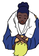
Nami-juji-jime Gewone gekruiste verwurging